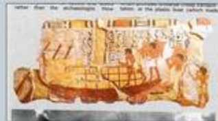
Transport de grains sur le NIL (18ème dynastie - 1350 av.J.C)