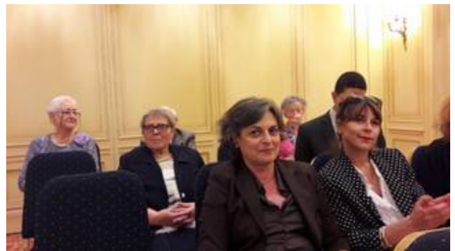
Partie de l'assemblée côté droit