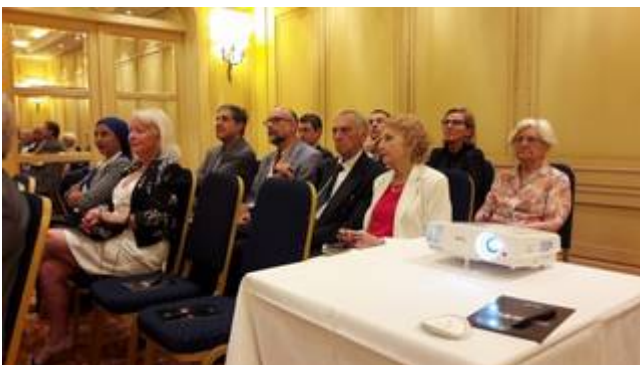
Partie de l'assemblée côté gauche