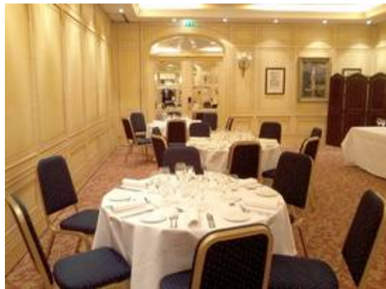
Vues de la salle du repas de Gala prête à recevoir nos invités (M. Lagarde).

Hélas, nous n'étions pas aussi nombreux que par le passé où les fondateurs de notre Académie étaient encore avec nous. Les temps changent et nos concitoyens actifs, souvent très âgés ou à la retraite certainement bien méritée, vivent maintenant, pour beaucoup d'entre eux, loin de Paris.